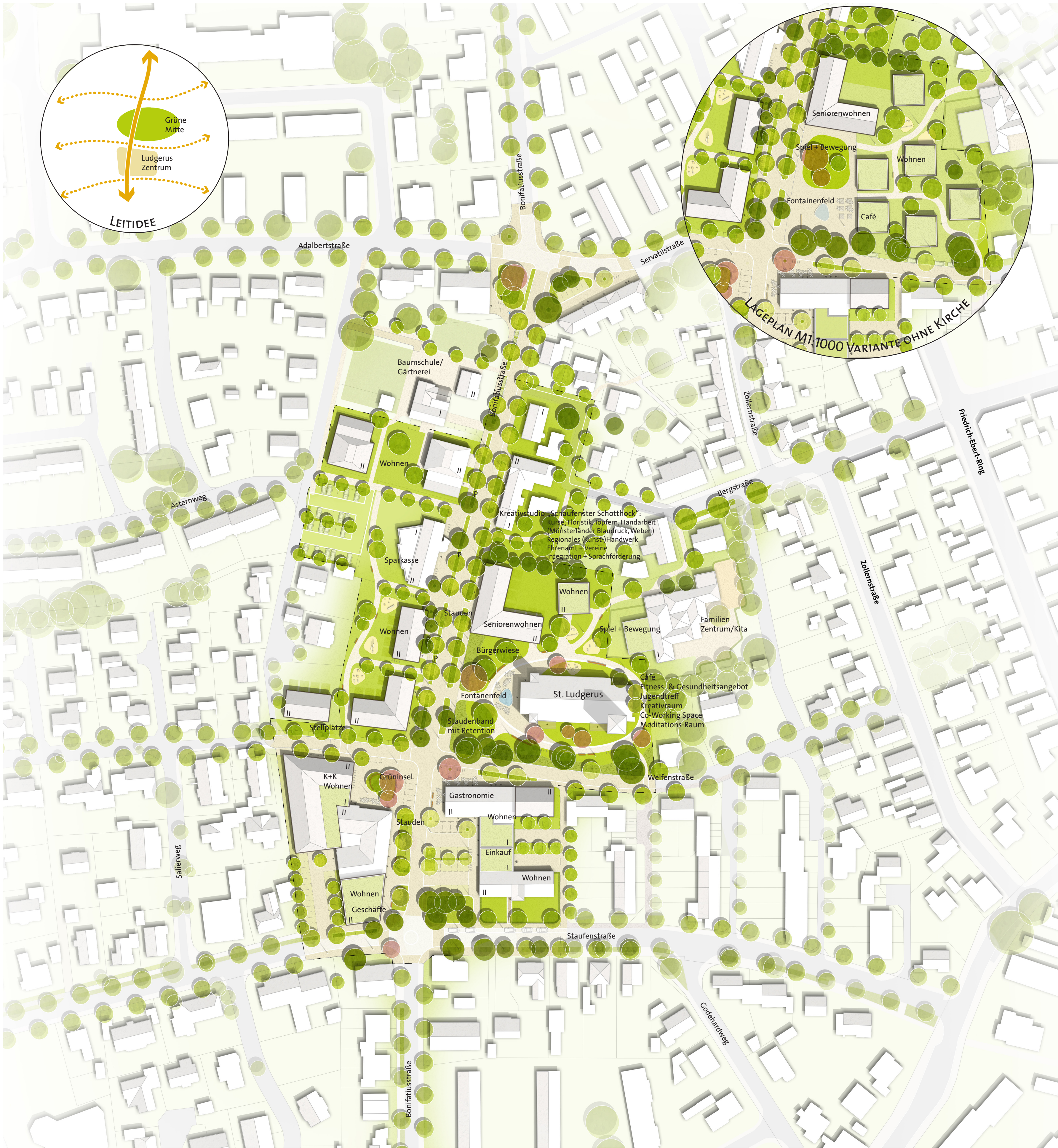
LAGEPLAN M 1:1000 BAULICHE ENTWICKLUNGSPOTENTIALE MODULARE ENTWICKLUNG, DIE AUF DAS ENGAGEMENT, DIE AKTIVITÄTEN UND DIE BÜDGETS VON KIRCHENGEMEINDE, BÜRGERSCHAFT, VEREINEN, STADT UND INVESTOREN REAGIEREN KANN