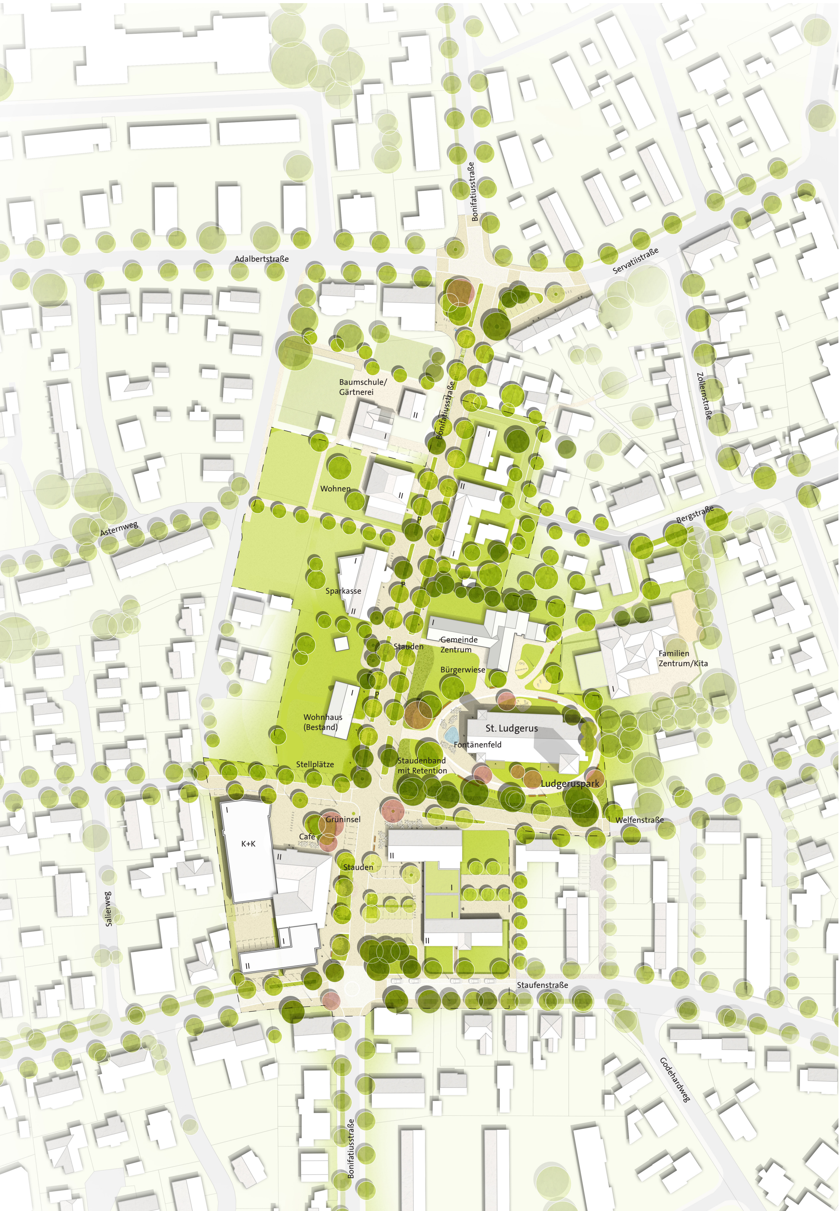
LAGEPLAN M 1:1000 AUFWERTUNG DES ÖFFENTLICHER RAUMES MÖGLICHE ERSTE ENTWICKLUNGSPHASE UNABHÄNGIG VON BAULICHER ENTWICKLUNG